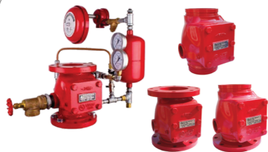
Válvulas de Governo