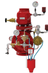
Sistemas de Pré-Ação