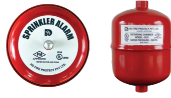
Motor de Alarme / Câmara de Retardo