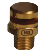
Projetores para Resfriamento de Tanques