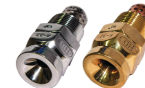
Projetores de Alta Velocidade