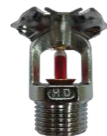
Sprinklers de Janela