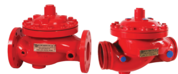
Válvulas de Dilúvio