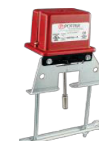
Supervisor para Válvula com Haste Ascendente