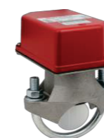
Chave de Fluxo