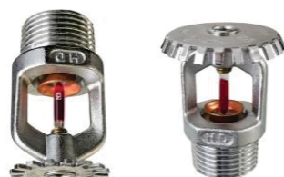
Sprinklers Pendentes / Upright