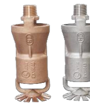
Sprinklers para Espuma