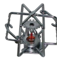
Acessórios para Sprinkler