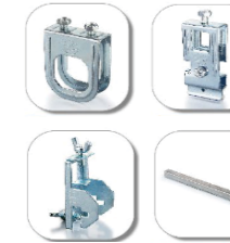
Acessórios para Mangueiras Flexíveis