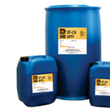
LGE (Líquidos Geradores de Espuma)