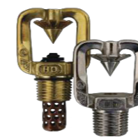
Projetores de Média Velocidade