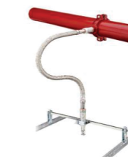
Mangueiras Flexíveis com Trança