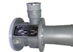
Proporcionadores de Espuma