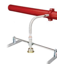
Mangueiras Flexíveis sem Trança